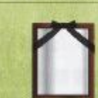
◆遺影写真・集合写真