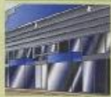
◆会場使用料・支那費