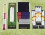
◆会場用顔香・ローソク