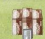
◆会葬礼状・巻封返し