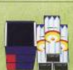
◆自宅用ローソク観音一式