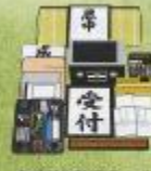
◆受付事務用品一式