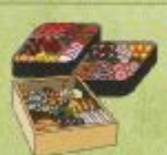
◆飲食関係・引出物