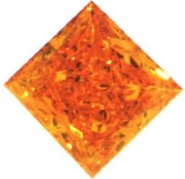
プリンセスカット