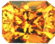
ラディアントカット