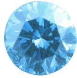
ブルーダイヤモンド